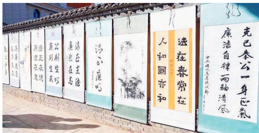
廉洁文化主题书法作品。