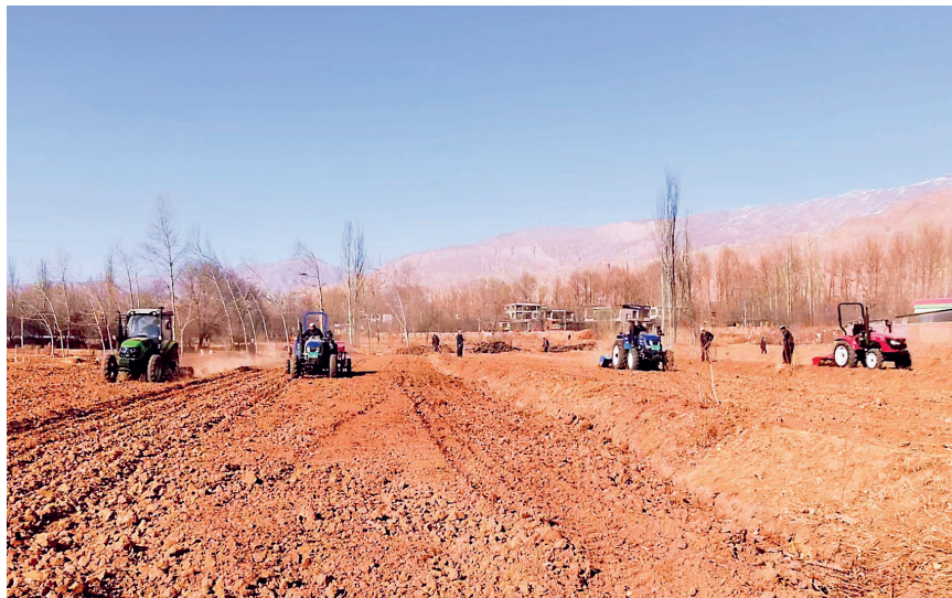
化隆县春播现场。

青海日报融媒体 2月28日讯 2月28日，记者从海东市纪委监委获悉，连日来，海东市纪委监委派驻第六纪检监察组立足监督主责，聚焦春耕备播生产各项工作任务，紧盯生产要素关键环节强化监督检查，督促推动有关部门保障春耕农资保供、涉农补助资金发放等重点工作，保障春耕生产各项工作平稳有序。