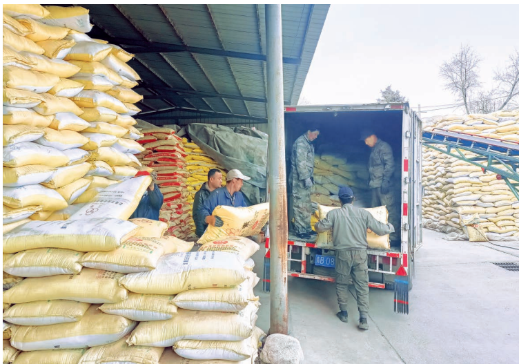
乐都区岗沟供销社化肥销售现场。