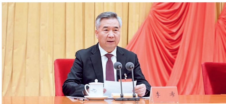
1月9日，中国共产党第二十届中央纪律检查委员会第二次全体会议在北京开幕。中共中央政治局常委、中央纪律检查委员会书记李希代表中央纪律检查委员会常务委员会作题为《深入学习贯彻党的二十大精神，在新征程上坚定不移推进全面从严治党》的工作报告。

中国共产党第二十届中央纪律检查委员会第二次全体会议于1月9日在北京开幕。中央纪律检查委员会常务委员会主持会议。9日下午李希代表中央纪律检查委员会常务委员会作题为《深入学习贯彻党的二十大精神，在新征程上坚定不移推进全面从严治党》的工作报告。