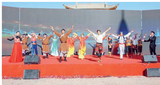
廉洁文化主题书法作品。

活动由中共循化县委、循化县人民政府主办，县纪委监委、县委宣传部、县文体旅游局承办，并得到了全县广大干部职工和群众的倾力支持，共收集到书法、绘画、刺绣、剪纸和石艺等作品 300 余幅，评