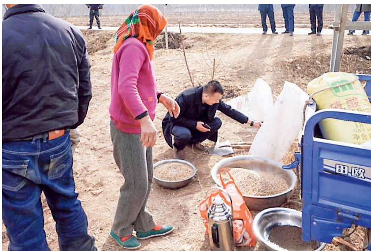
海东市农业农村局农技人员开展技术服务指导。