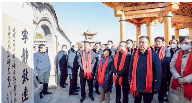
大家在现场观赏书法作品。

青海日报融媒体 1月20日讯 “青海年·醉海东·循化游”系列活动暨“清风廉韵润循化·深情礼赞二十大”廉洁文化作品展日前在海东市循化撒拉族自治县撒拉尔故里民俗文化园启动。