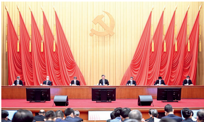
1月9日，中共中央总书记、国家主席、中央军委主席习近平在中国共产党第二十届中央纪律检查委员会第二次全体会议上发表重要讲话。李强、赵乐际、王沪宁、蔡奇、丁薛祥、李希出席会议。

习近平强调，构建全面从严治党体系是一项具有全局性、开创性的工作。新时代十年，我们党不断深化对自我革命规律的认识，不断推进党的建设理论创新、实践创新、制度创新，初步构建起全面从严治党